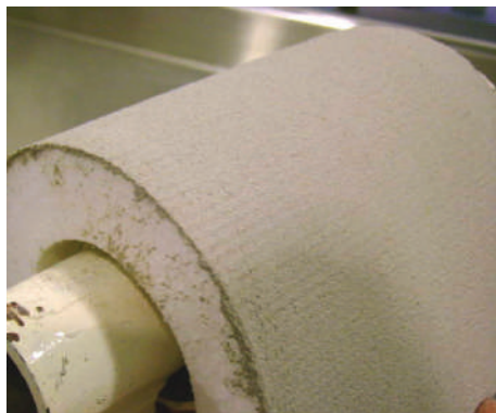
Prueba de Resistencia a la Flexión sin Agrietamiento